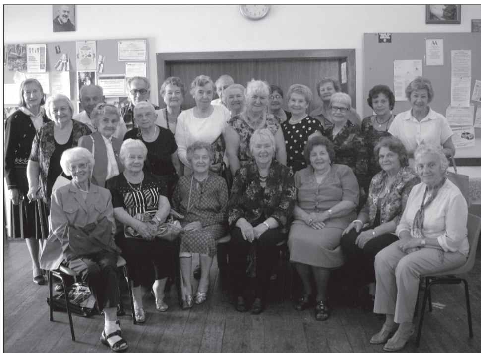
Obecni Sybiracy w Zachodniej Australii