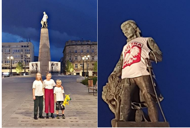
Dziobaki – polonijna młodzież z Australii pod pomnikiem Tadeusza Kościuszki w Łodzi (pomnik ubrany w polską koszulkę).