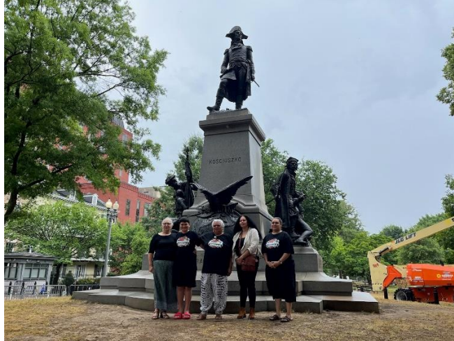
Chór Djinama Yilaga pod pomnikiem Tadeusza Kościuszki w Washington DC

Pamiętamy o Pańskiej obecności na galowym koncercie kończącym Międzynarodowy Konkurs z okazji Roku Strzeleckiego 2023,